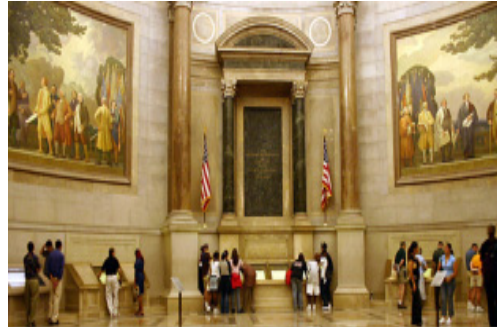
〈그림 5〉 미국 수도 워싱턴 국가기록관리청 내의 원형전시장(The Rotunda for the Charters of Freedom in the National Archives Building)