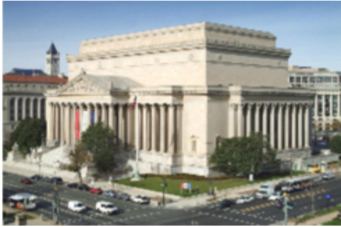
〈그림 4〉 미국 수도 워싱턴의 국가기록관리청 (The National Archives Building in Washington, DC.)