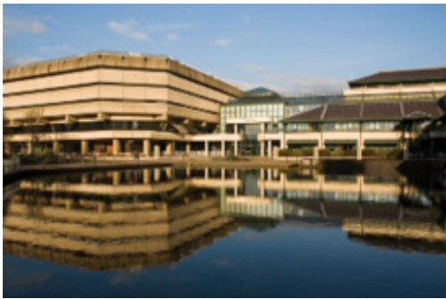
〈그림 6〉 영국 런던의 국가기록원 (The National Archives, www.nationalarchives.gov.uk )