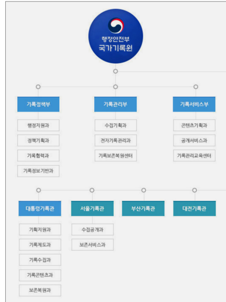
〈그림 8〉 국가기록원 조직도

만 수행하라는 조직 구조이다. 국가기록원의 인력 현황은 〈표 5〉에 상세히 나와 있다.