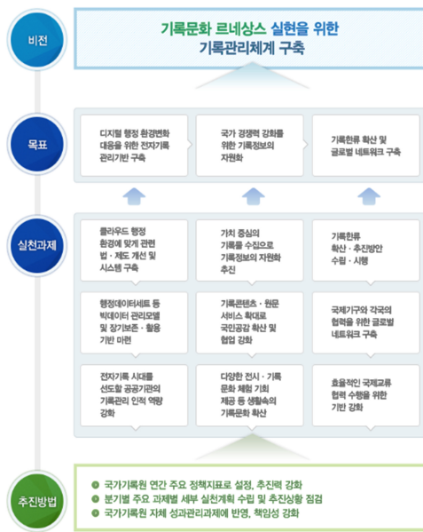
<그림 3> 국가기록원의 비전

2017년 현재 국가기록원의 비전은 무엇일까? 국가기록원의 비전(국가기록원, 기관 소개, http://www.archives.go.kr/next/organ/vision.do )은 <그림 3>에서 보듯이, “기록문화 르네상스 실현을 위한 기록 관리체계 구축”이다.