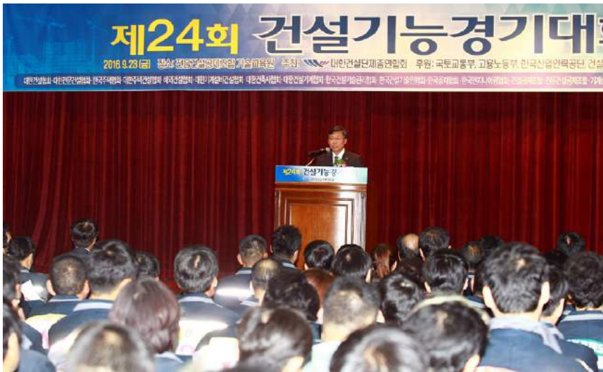
제24회 건설기능경기대회가 지난 9월 23일 전문건설공제조합 기술교육원에서 성황리에 개최됐다

제24회 건설기능경기대회가 지난 9월 23일 충북 음성군 금왕리 전문건설공제조합 기술교육원에서 성황리에 개최됐다. 이날 대회에는 전국 건설공사 현장에서 130만 건설기능인을 대표해 239명이 14개 직종(거푸집, 건축목공, 미장, 조적, 철근, 타일, 건축배관, 전기용접, 도장, 측량, 조경, 전산응용도목제도, 실내건축, 방수)에 출전해 기량을 겨뤘다.