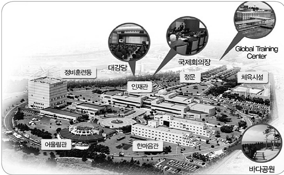
〈그림 3〉 한수원 인재개발원 전경