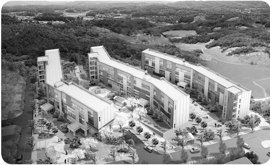
〈그림 4〉 온누리관(제2생활관) 조감도

를 위한 건강관리실, 고객지원센터, 교육생 복지프라자, 포토키오스크 등으로 1층에 구성되어 있다. 2층에는 교수실, 도서관, 지원사무실 등으로 배치되어 있다.