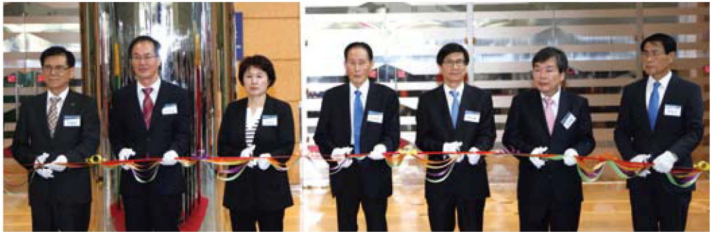
제34회 국제안전보건전시회 개막식