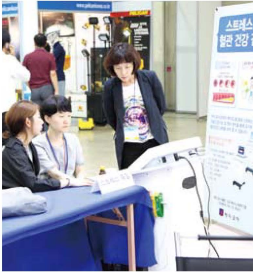
협회 부스_스트레스 측정 체험