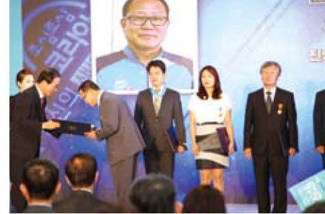
산업재해예방 유공자 포상