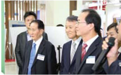
전시장 업체 소개