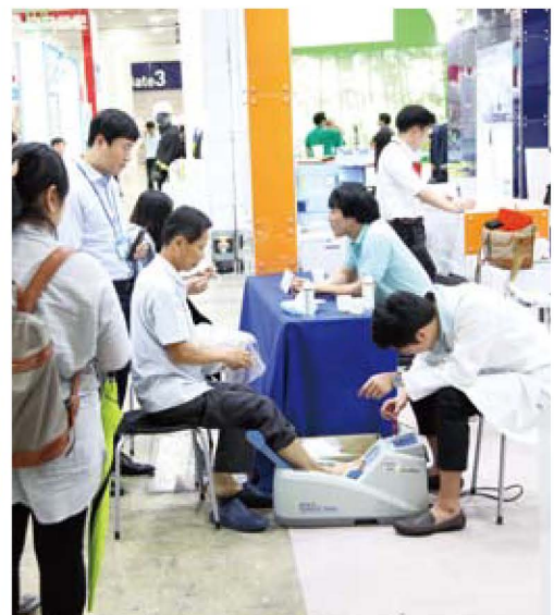
협회 부스_골밀도 측정 체험