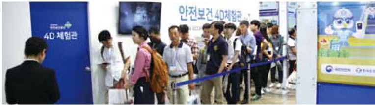
공단의 안전보건 4D체험관