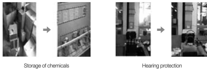
〈그림1〉 작업환경 및 보건관리 지도 전후 비교

Note: 1) PPE usage, Health effect, Work-related musculoskeletal disorders (WMSDs)