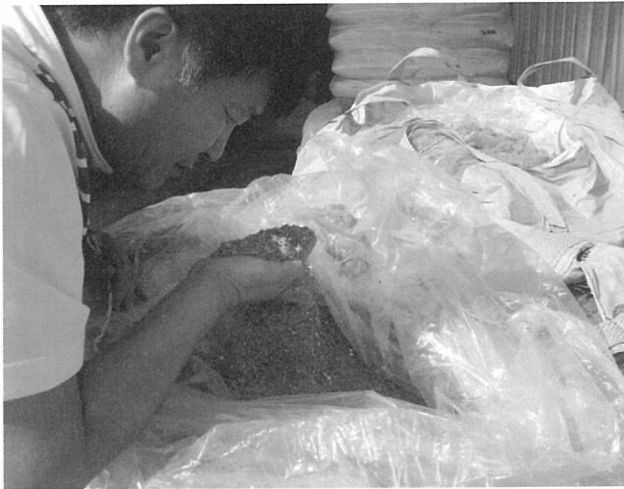
[그림 4] 완성된 TMF사료 관능검사

또한, 송암농장은 사양관리 기술 개발과 축적을 위해 선진 농가의 기술 도입, 정보 공유 및 컨설팅, 그리고 축산물품질평가원에서 제공해주는 등급판정 분석 결과 적극 활용을 토대로 지속적으로 고급육 생산기술 개발에 노력하는 농가입니다.