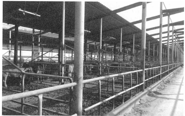
[그림 3] 4두 이하 두수 사육 전경

송암농장의 강점 중 하나는 버섯배지를 사료급여에 적용하여 영양학적으로나 기호적으로 최적화된 배합비를 도출해 자체 TMF사료(완전혼합발효사료)를 생산하고 있다는 점입니다. 버섯을 재배하면서 균 배양에 쓰인 배지를 버리지 않고 배지에서 나오는 미생물과 배지영양분을 사료로 이용하고 있습니다. 친환경 순환농법을 실천하고 있는 농가인 것이지요.