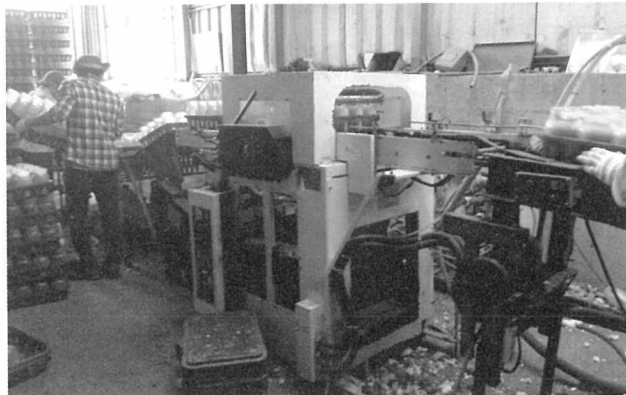
[그림 2] 버섯배지 추출