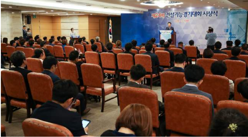
제24회 건설기능경기대회가 지난 10월 17일 서울 논현동 건설회관 중회의실에서 개최됐다

제24회 건설기능경기대회 시상식이 지난 10월 17일 서울 논현동 건설회관 중회의실에서 개최됐다. 이날 시상식에서는 지난 9월 23일 개최된 건설기능경기대회에서 우수한 성적을 거둔 64명의 입상자에게 상장과 부상을 수여했다.