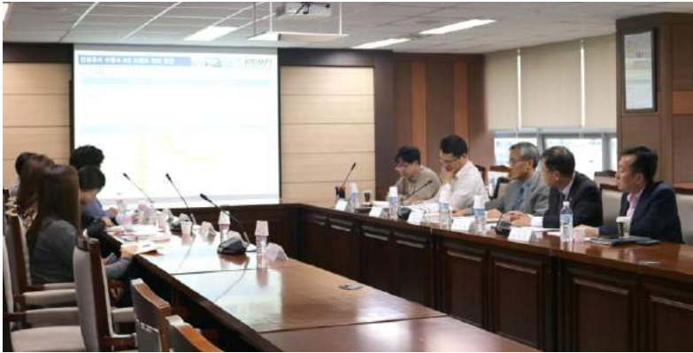
연구원은 지난 10월 21일 2016년도 제3차 연구심의위원회를 개최했다