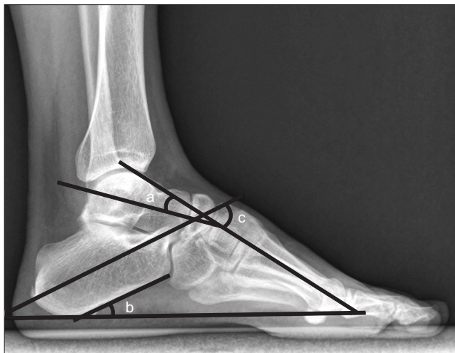
Figure 2. On standing lateral view of cavus foot, (a) talo-1st metatarsal angle (Meary's angle), (b) calcaneal pitch angle, and (c) calcaneo-1st metatarsal angle (Hibb's angle) can be measured.

족부 보조기는 요족의 보존적 치료에 있어 매우 중요한 역할을 하고 있다. 전형적인 요족 변형의 보조기는 뒤꿈치를 올려주어 경직된 비복근에 도움을 주고, 제 1중족골 골두 기저에 와(recess)를 만들고 전족부의 외측을 받쳐주어 족저골곡된 제 1중족열 변형 및 전족부의 회내 변형의 효과를 감소시켜 후족부 내반 교정에도 영