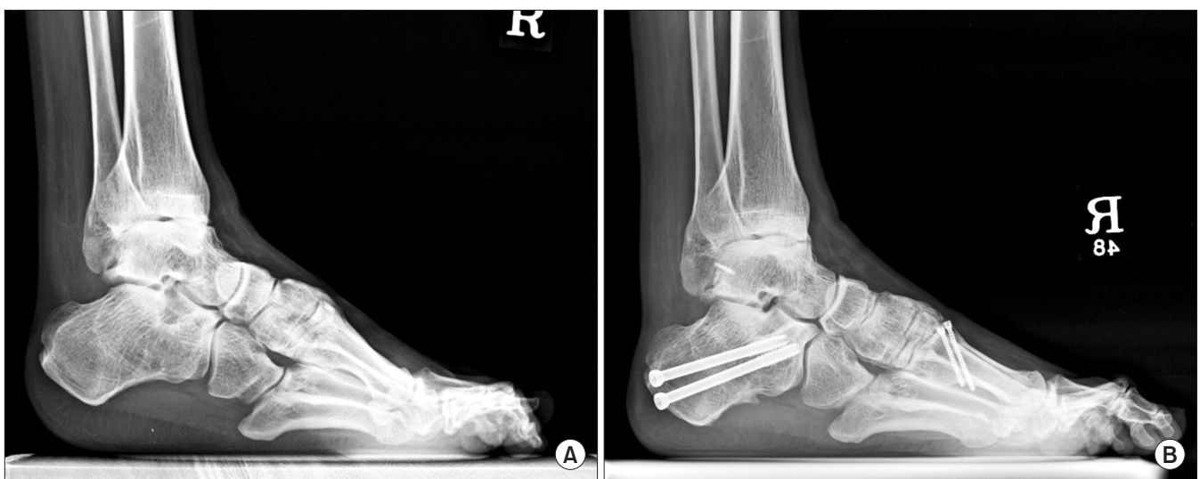
Figure 3. (A) The standing lateral radiograph of right foot showed a severe cavovarus deformity. Reconstruction of cavovarus foot was done with a calcaneal lateral closing wedge osteotomy, 1st metatarsal dorsiflexion osteotomy, plantar fascia release, Achilles tendon lengthening, a modified Broström operation and tibialis anterior tendon lateralization. (B) The standing lateral radiograph for 1-year follow-up after surgery showed a balanced and plantigrade foot.

아킬레스건과 하퇴 삼두근의 구축 및 단축은 후족부 내반 변형에 이차적인 내번근(secondary inverter)이 되며 침착 변형에 영향을 주어 전족부에 과부하가 올 수 있다. 아킬레스건 및 비복근 연장술은 후족부에 구축된 내반 변형 및 침착 변형이 동반된 경우 절골술과 동반하여 시행할 수 있으며, Silfverskiöld test를 바탕으로