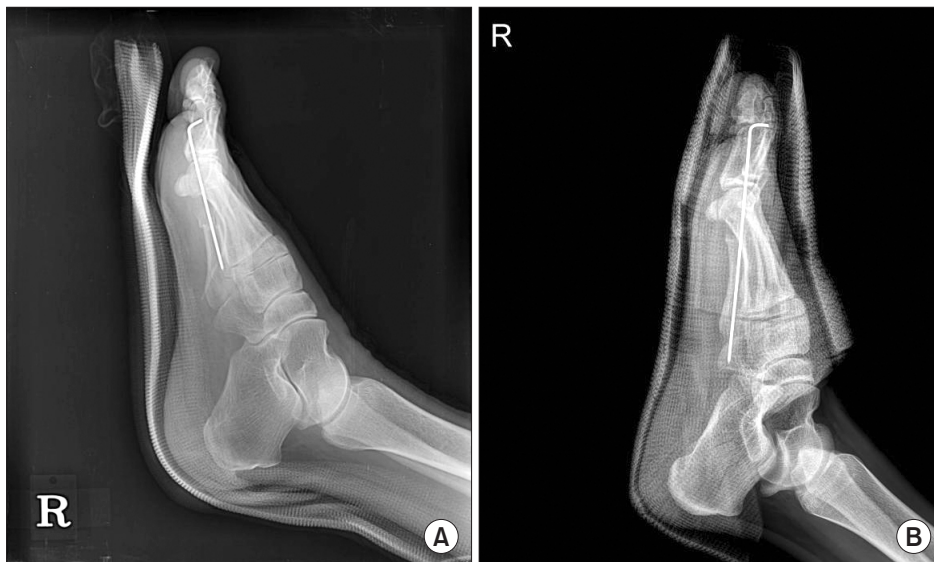
Figure 2. (A) A lateral radiograph of a foot shows a short leg splint applied postoperatively. (B) A lateral radiograph of another foot shows a foot cast applied postoperatively.