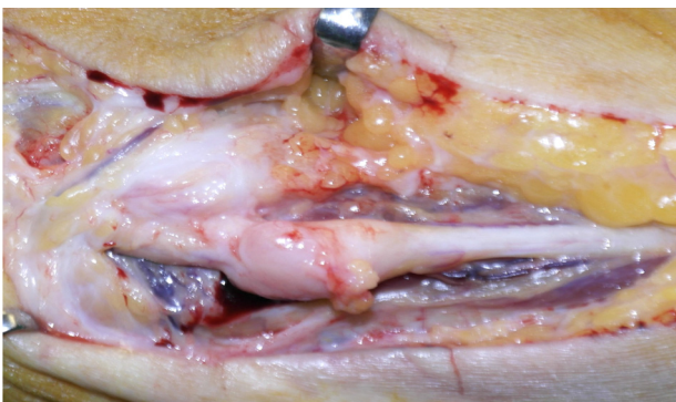
Figure 3. Intraoperative photograph of case 2. The mass lesion seems rather enclosed by epineurium than isolated from the ulnar nerve as a cyst.

신경초음파에서 상완골의 안쪽위관절융기 근처에서 척골신경이 14.1×4.4 mm 크기의 종괴에 의해 압박되어 압박되지 않은 부위에 비해 단면적이 0.06 cm 2 에서 0.02 cm 2 로 감소되어 있었다(Fig. 2). 진단 15일 후 절제술을 시행하였