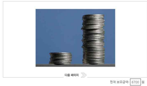
그림 3. 과제 2: 동전 개수 세기 화면

문비를 받게 되며, 자문가가 주사위 B를 선택 하면 반대로 파트너가 3,000원대, 자문가가 6,000원대의 금액을 받게 된다. 즉, 파트너에게 더 많은 금액이 제공될수록 자문가는 더 적은 금액의 자문비를 받게 되었다. 자문가는 파트너에게는 공개되지 않는 정보를 추가로 알고 있으며, 파트너에게 정보를 제공하는 명목으로 기본 자문비 1,000원을 지급받았고 파트너가 좋은 선택을 할 수 있도록 조언하는 역할임이 사전에 안내되었으므로, 주사위를 선택하는 것은 자문가로서의 임무와 개인의 재정적 이익이 상충하는 이익충돌 상황이었다. 따라서 주사위 선택 과제에서 자문가가 주사위 A를 선택한다면 자문가 임무에 충실한 자문가로서의 의사결정을, 주사위 B를 선택한다면 개인의 재정적 이익을 따르는 의사결정을 내린 것으로 간주하였다. 주사위 선택 이후 화면에서는, 참가자의 응답 값을 바탕으로 계산된 자문비가 제시되었으며 해당 자문비는 화면 우측 하단의 현재 보유금액 란에 합산되었다.