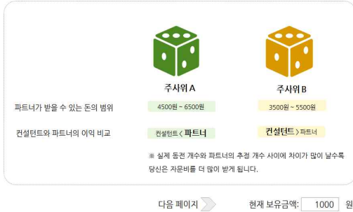
그림 2. 과제 1: 주사위 선택 화면