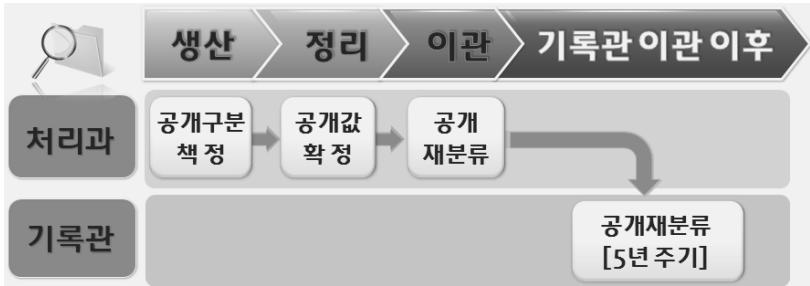
〈그림 1〉 기록물의 공개관리 절차

그러나 현실적으로 공공기관 처리과 내에서는 이런 작업이 거의 이루어지고 있지 않으며, 생산당시 기안자가 결정한 초기 공개값 그대로 기록관으로 이관되고 있는 실정이다. 기록관에서 교육이나 공문 등을 통한 안내를 하더라도 공공기록물법에서 규정하고 있는 생산부서에서의 3차례 공개여부 분류과정은 이루어지지 않고 있으며, 이관 전 재분류 실시여부에 대해서도 확인할 방법이 없다. 게다가 생산시점과 정리 기간, 이관시점에 각각 해당 기록물의 업무담당자가 바뀔 경우에는 생산시점의 공개여부를 수정하고 변경하는 것에 대하여 대부분의 업무담당자들이 많은 부담을 느낀다.