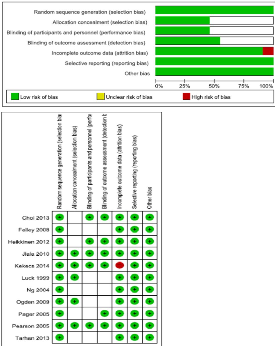
Figure 2. Assessment risk of bias in selected studies.

Heikkinen 26) 은 환자의 개인의 필요에 따라 평균 2.3회 웹사이트를 이용하여 정보를 제공받았고, 환자들의 평균 이용시간은 81분이었다.