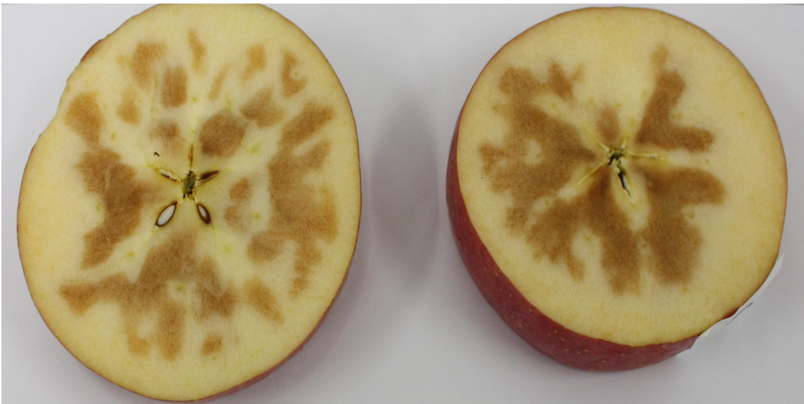
Fig. 3. Normal shape (a) and shape after internal browning (b) of early season Fuji apples stored under different CA conditions.