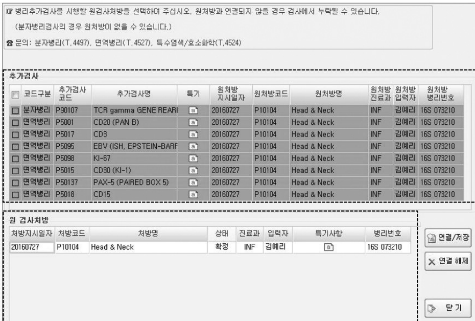
Figure 3. Construction of ancillary tests matching system for clinical department (A) The list exam of histopathology (B) Ancillary tests linked with histopathology