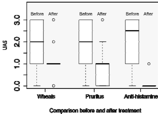
Fig. 2. UAS intensity distribution at initial and after treatment

처음 내원시와 마지막 내원시를 비교하여, 만성 두드러기의 증상이 완전히 관해된 경우는 5명(16.67%),