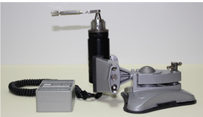
Fig. 4. Digital torque gauge fixed with a vice for stability.