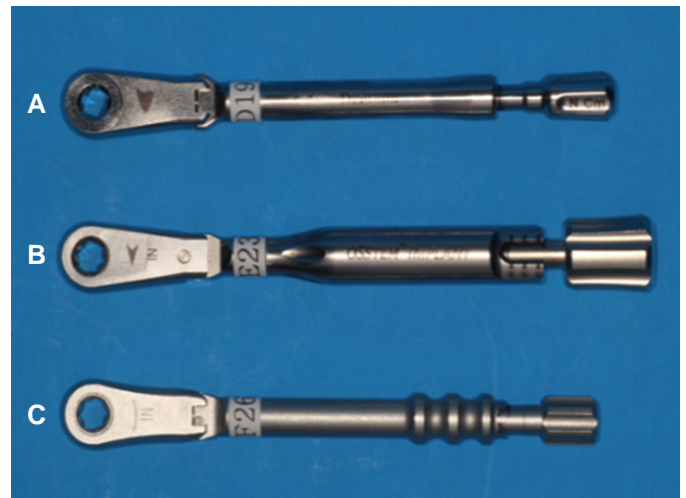
Fig. 2. Friction-style mechanical torque wrenches (A: Dentium, B: Osstem, C: Shinhung).