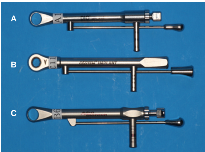
Fig. 1. Spring-style mechanical torque wrenches (A: Dio, B: Osstem, C: Neobiotech).

각기 다른 5개 대한민국 임플란트 제조사(Dio, Dentium, Neobiotech, Osstem, Shinhung)의 6가지 제품군의 기계식 임플란트 토크 렌치가 목표 토크값에 대한 정확도를 측정하기 위해 선택되었다. 이중 스프링형 그룹은 Dio, Neobiotech, Osstem의 제품이었고(Fig. 1), 마찰형 그룹은 Dentium, Osstem, Shinhung의 제품이 었다(Fig. 2). 각각의 제품마다 5개씩, 총 30개의 토크 렌치를 스프링형과 마찰형으로 분류하여 무작위로 1 - 30까지 숫자를 부여한 후 실험에 사용하였다(Table 1).