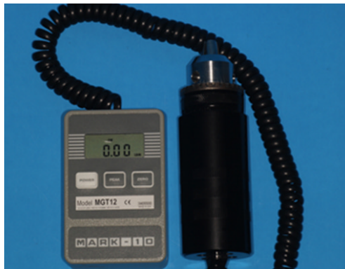
Fig. 3. Digital torque gauge (MGT-12).

각각의 토크 렌치는 측정 시 재현성을 위하여 목표 토크값에 도달하는 지점에 참고점을 표시하였다. 바이스에 의해 고정된 디지털 토크 측정기의 값은 0으로 설정하였다. 실험은 두 명이 참여했으며, 한 명은 토크 렌치를 잡고 목표 토크값에 도달할 때까지 4초간 천천히 힘을 가하였고, 한 명은 나머지 실험자에게 값을 알려주지 않은 상태로 디지털 토크 측정기에 표시된 값을 측정 기록하였다. 동일한 방법으로 각 토크 렌치의 토크값을 10회 반복 측정하였다.