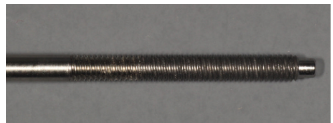
Fig. 7. Lubricant remnants of spiral part of torque wrench.