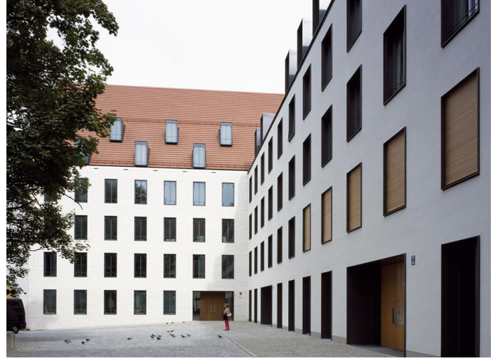
Alter Hof, München, Auer & Weber

계획이 되고 이 계획이 모두 적용이 됩니다. 하지만 한국에서는 굉장히 빨리 계획이 되고 현장에서 또한 바뀝니다. 이러한 차이들이 없었다면, 프로젝트 진행이 쉬워질 수 있었겠지요. 또 다른 하나는 바로 대화입니다. 프로젝트 시작 단계에서 저는 제 한국동료들과 오로지 그림과 간단한 영어 단어를 통해 대화를 할 수 있었습니다. 이 부분에서 제가 많이 놀랐던 이유는, 저는 평소 한국을 굉장히 서구적인 국가라 생각했고, 그리고 영어가 더 통상적이라고 생각했었습니다. 이 부분은 프로젝트가 마감이 될 때까지 단순한 통역이상의 큰 부분이었습니다. 사실은 이 프로젝트가 이러한 조건 안에서 마감될 수 있었다는 것은 거의 기적이었습니다. 우리에게 GS Caltex Pavilion을 위한 계획단계에서 개장까지 주어진 시간은, 불과 8개월 정도였습니다. 이러한 시간 계획은 독일에서는 상상할 수 없는 부분이지요. 이 프로젝트 진행과정에서 우리에게 성실한 동료들(창조건축)이 있었고, 마감까지 성실하게 진행했었던 현장의 좋은 팀이 있었기에 가능했습니다. 또한, 저희를 보이지 않는 프로젝트의 완성을 위해 끝까지 믿어줬던 GS Caltex와 People Works분들께도 감사드리고 싶어요.