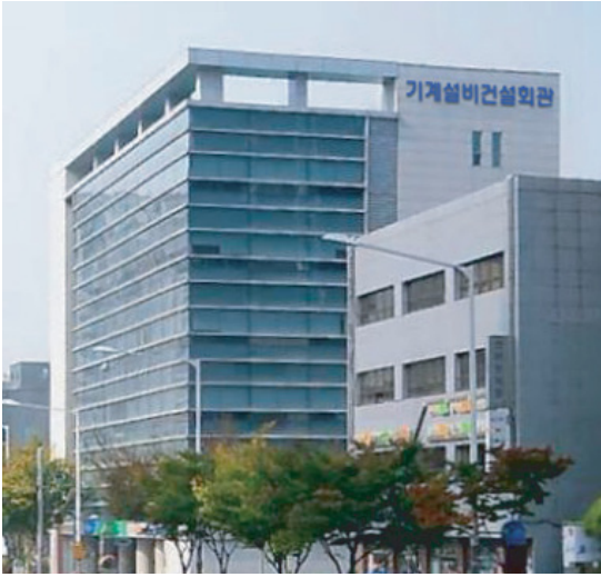
조합 본부 사옥