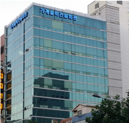
조합 부산 사옥