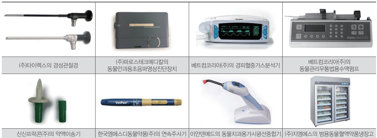
〈그림 1〉 2014년 4/4분기에 신규 등록된 동물용 의요기기 제품의 외관 사진