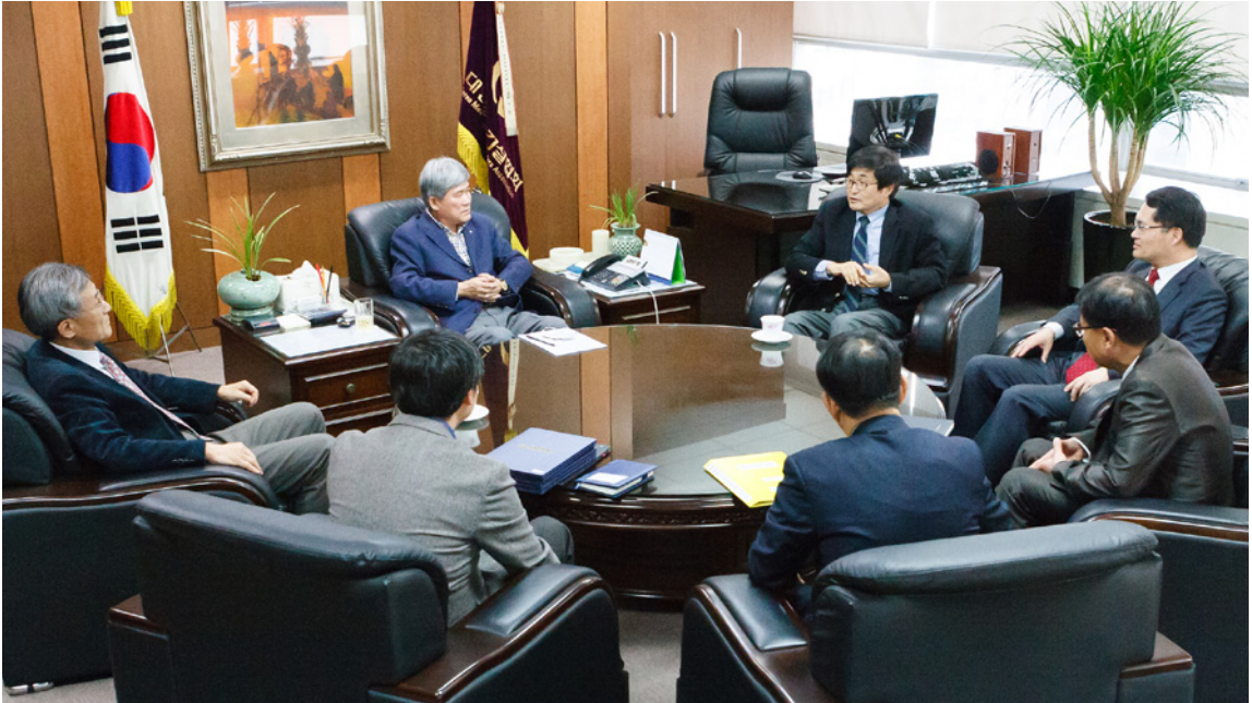
대한기계설비산업연구원은 지난 4월 6일 연구심의위원회 구성하고 첫 회의를 개최했다