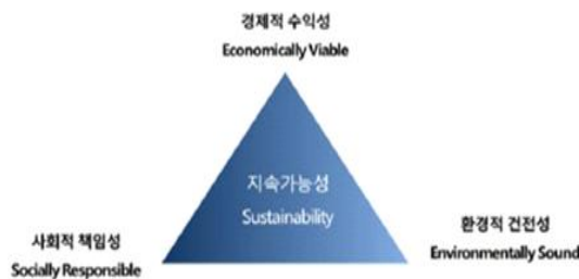
그림 1. 지속가능성을 구성하는 Triple bottom line

지속가능성의 개념은 경제적 수익성, 환경적 건전성, 사회적 책임 경영 등 경제적·사회적·환경적 영역을 아우르는 광의적 개념으로 해석된다. 경제적 관점은 수익성, 부가가치창출, 생산성증대, 고용창출 등 경제적 수익성을 내포하며, 인권, 노동, 제품책임, 사회공헌, 공정경쟁 등은 사회적 관점에 포함된다. 마지막으로, 환경적 관점에서 온실가스, 오염물질, 소음/공해, 자원보존, 친환경생산 등 생산 및 사회활동에서 야기되는 다양한 환경부화의 가능성을 다룬다.