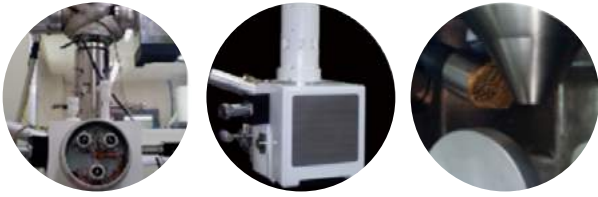
[Fig. 3] 국산화된 FE-SEM 외형과 Conical Lens

안되어야 한다. 상기에 언급한 전자현미경부의 경통 설계 지침은 이미 국내 몇몇 기업에서 고유의 모델들을 제품화하고 있기 때문에 매우 기초적인 기반기술로 무시될 수 있으나, 시장에서 요구하는 기술융합 및 특정 목적의 제품화에 대한 수요에 대비하기 위해서는 자체적으로 반드시 숙지되어야만 하는 요소기술이다. 즉, 신기술을 통한 제품경쟁력 확보도 필요하지만, 기존의 판매하고 있는 제품의 특성치들을 숙지하게 되면, 그 제품을 통하여 다양한 용도의 응용기술 및 파급기술들을 구현할 수 있는 전문적인 시야가 형성되기 때문이다.