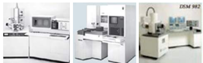
[Fig. 2] 세계 최초로 상용화된 S800(FE-SEM, 좌), S-6000(CD-SEM; 가운데) 및 Leica FE-SEM

상으로 코팅처리 없이 고분해능으로 관찰 및 측정/분석을 하고자 하는 수요가 늘어나면서 저진공 SEM과 같은 응용기술들이 제품화되었다. 2010년대에는 메모리 반도체 소자의 design rule이 약 10 nm로 축소화되었고, 3차원 구조의 형상으로 변모하면서 이에 대한 측정/분석 기술이 요구되고 있고, 따라서 수차보정 기술과 3차원적인 영상구현의 필요성이 크게 대두되고 있다. 실질적으로 선진 경쟁국에서는 수차보정 기술 확보를 위하여 이미 막대한 연구비를 투자하여 선행기술을 확보하기 위한 전쟁이 가시화되고 있다. 일차적으로 일부 확보된 수차보정 기술들은 이미 투과전자현미경에 적용되어 분해능 개선의 효과들이 검증되고 있고, 또한 제품화가 이루어지고 있으나, 가중되는 가격부담과 유지/보수 차원에서 비실용적인 문제로 인하여 보급화에는 많은 어려움을 겪고 있다. 또한 일부 고안된 요소기술들을 이미 주사전자현미경에 적용하고자 하는 시도들이 있지만, 정상적으로 제품화에 따른 보급화가 이루어지기까지는 다소 시간이 소요될 것으로 예상된다. 그러나 궁극적으로는 조만간 현실화될 것이므로 이에 대한 대책이 시급한 상황이다.