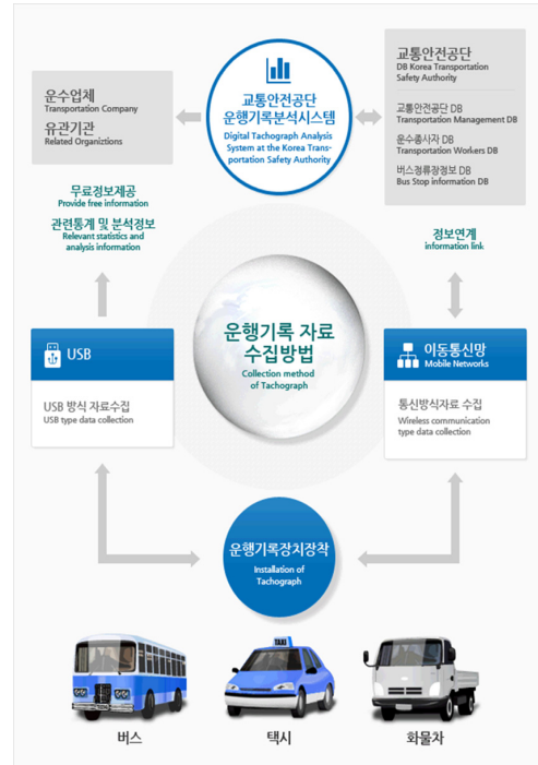
그림 1. 교통안전공단 운행기록분석시스템

위험행동에 대해 운전자에게 피드백을 한 결과 사고가 평균 6.3건/10,000시간에서 3.91건/10,000시간으로 감소하는 효과가 나타났다.