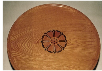
Fig. 2. Yuseokgeun masters of Gongju Tray.

유석근 명장이 주로 하는 작품은 조선조 소반을 기반으로 한 전통소반의 현대화이다. 이 소반은 앞서 언급한 목 조각은 물론 짜 맞추는 또한 어느 정도 경지에 있어야 제작이 가능한 최소한의 가구이다. 소반은 전통적 좌식생활이었던 우리나라의 가구의