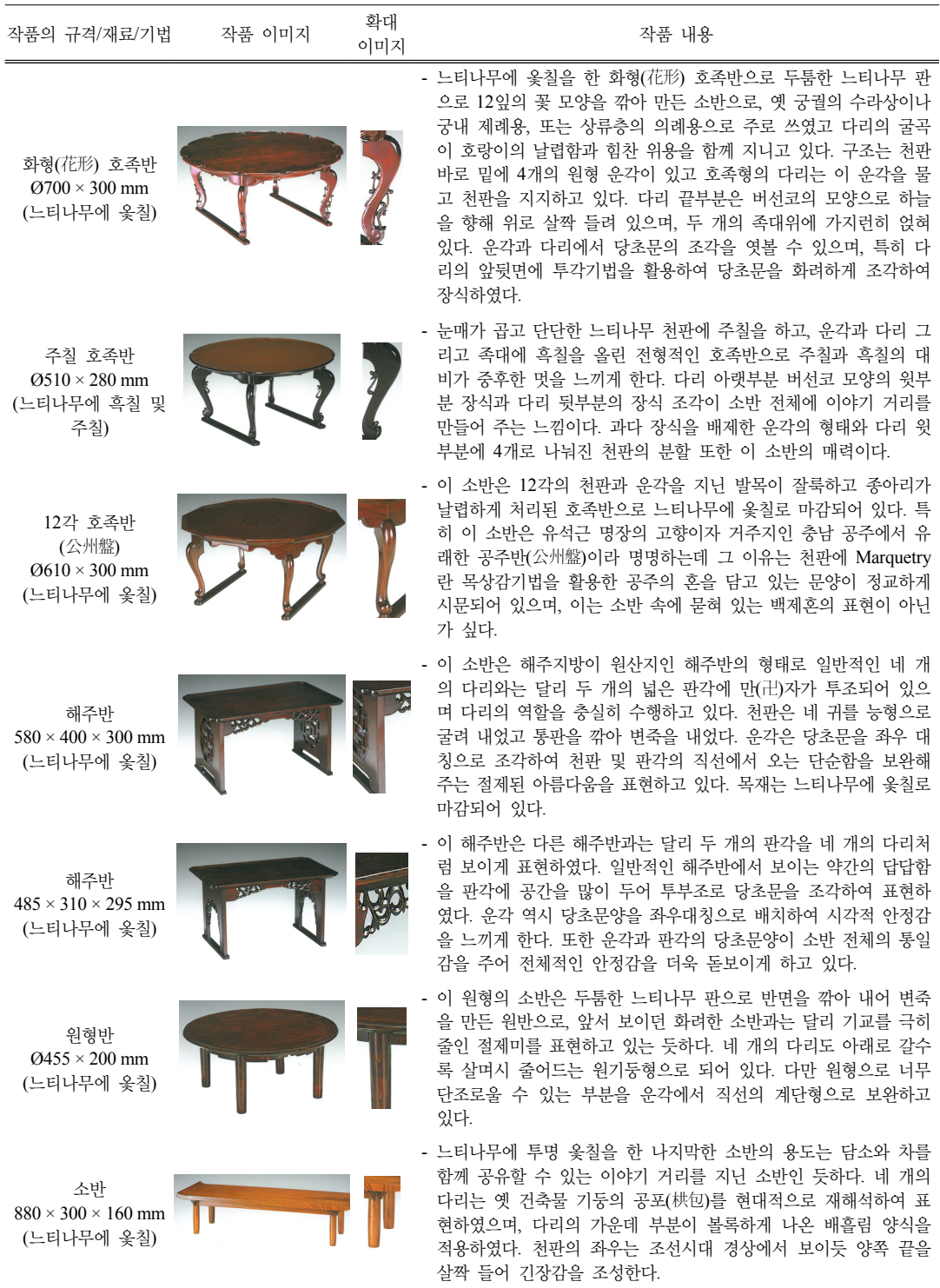
Table 4. Yu Seokgeun Masters of the Works (Dining Table)