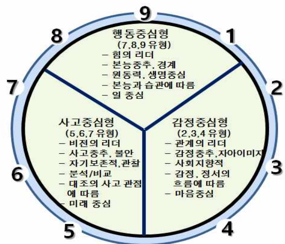
출처: 연구자 재구성(한국형 에니어그램 프로파일 참조) <Figure 1> 에니어그램의 힘의 중심 모형

여러 가지 성격유형 이론 중에서 에니어그램을 사용한 이유로는 첫째, 에니어그램은 자기이해를 통한 성장을 목표로 삼고 있다. 둘째, 에니어그램은 보편성으로 성별, 연령, 인종, 종교 등에 차이가 있어도 사용이 가능하며, 셋째, 에니어그램은 인간의 내적동기와 성장 및 발달을 지향하여 장점과 약점을 이해할 수 있다. 넷째, 에니어그램은 특정 성격유형의 반응양식을 예측가능하며, 관점과 가치관, 동기, 목적 등에 대한 정보와 상황에 대한 반응양식을 알려주기 때문이다(Ko-Lee, 2013).