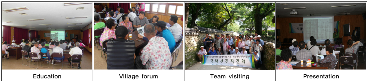
Figure 5. Education and visiting for empowerment by each team