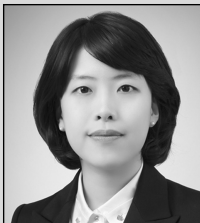
이 고 운

이는 일련번호 추가에 따른 비용과 시간 부담, 미국·EU의 도입 일정 지연 등을 고려한 것으로, 전면 시행이 어려운 제약사의 경우, 생산·수