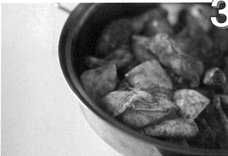
3 닭고기, 감자, 양파를 양념장에 버무려 재운다.