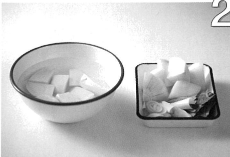
2 준비한 채소는 각각 손질해 준비한다.