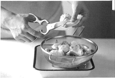
1 닭날개 끝은 가위로 잘라낸다.