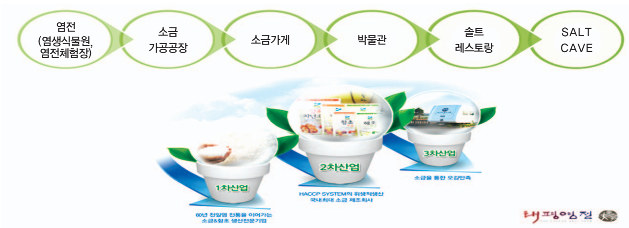
〈그림 3. 태평양염(소금) 6차 산업화 사례〉

태평양염은 6차 산업화를 통해 연간 431명, 152억 원 가량의 매출액을 올리고 있다. 2013년 기준으로 2차 산업의 영역인 (주)태평소금에서 257명 고용, 77억 원의 매출이 나타났다. 하지만 어촌 힐링·치유산업을 테스트베드(Test-bed) 차원에서 운영 중인 상황에서 18억 매출과 59명의 고용창출이 이루어진 점은 매우 고무적인 상황이라고 볼 수 있다.