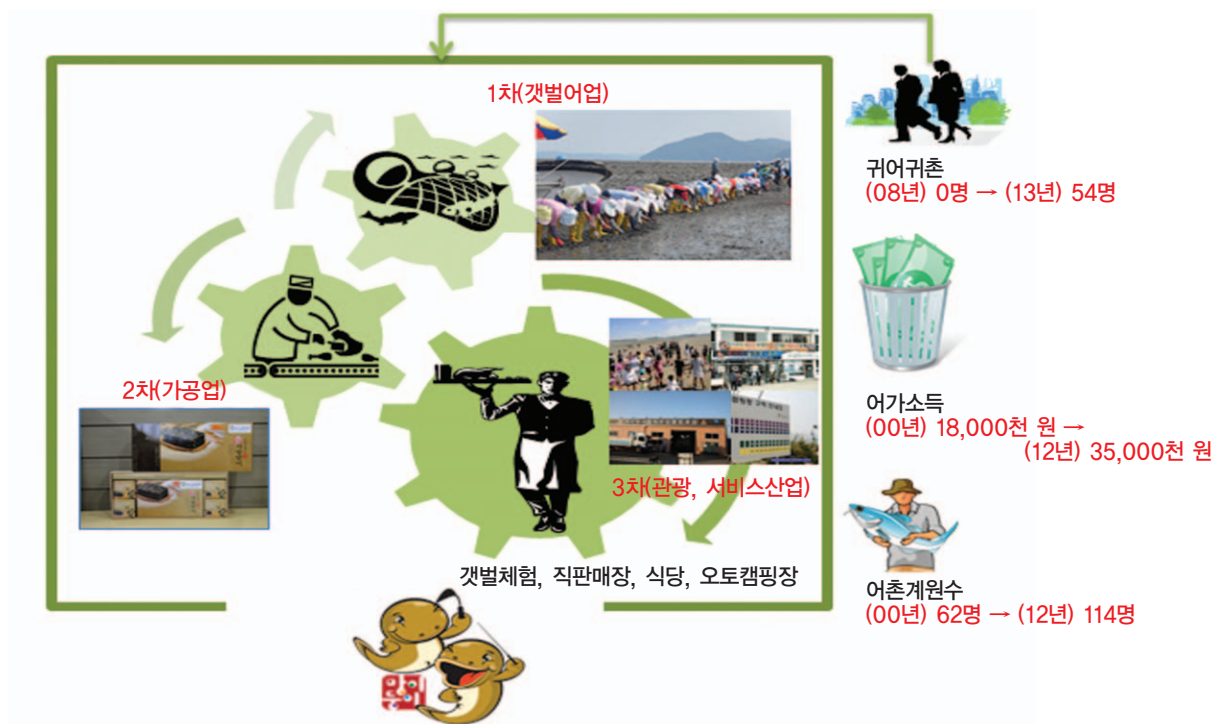
〈그림 2. 백미리 자율관리공동체 6차 산업화 사례〉

특히, 최근에는 오토캠핑장 등 외부의 민간개발이 백미리 어촌공동체와 연계하여 사업이 이루어지면서 사업 연대를 통한 시너지 효과가 발생될 것으로 기대되고 있다.