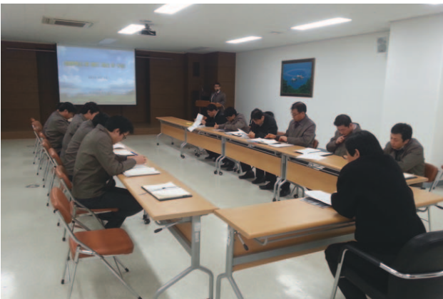
TF 전체 토론(2. 3)

‘경영혁신 및 제도개선 TF’는 지난 2월 초, 노병환 상임이사를 단장으로 역량강화, 조직정비, 업무개선의 3개 분야로 나누어 협회 각 부서의 핵심인재 위주로 총 15명의 팀원으로 구성되어, TF 전체토론 및 전 직원 대상 보고회 각 2회, 수차례의 반별 토론회를 거쳐 지난 3월 초, ‘경영혁신 및 제도개선 TF 활동 최종보고서’ 제출을 끝으로 한 달간의 활동을 모두 마무리하였다. 이에 그간의 TF 활동과 도출된 주요 개선과제에 대해 간략히 소개하고자 한다.