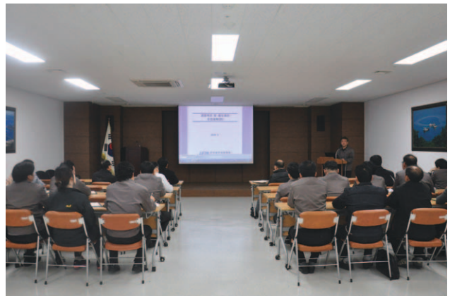
전직원 대상 설명회(2. 21)