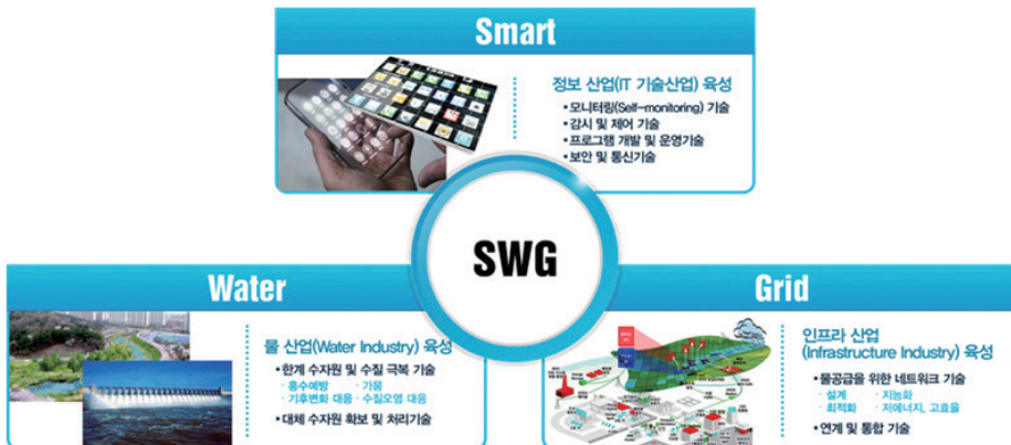
그림 1. Smart Water Grid 기본 개념

A : 스마트 워터 그리드(Smart Water Grid, 이하 SWG)는 기존 수자원 관리 시스템의 한계를 극복하기 위해 첨단 정보통신 기술을 이용하는 고효율의 차세대 물관리 인프라 시스템으로, 빗물이나 해수 등 다양한 수원을 활용하고, 물을 효율적으로 배분·관리·운송하여 수자원의 불균형을 해소하는 융합기술이다. 기본 개념을 살펴보면 SWG는 크게 Smart, Water, Grid로 나눌 수 있으며, Smart는 가뭄이나 홍수와 같은 기후변화와 녹색성장에 대응하기 위한 분산형 수자원, 그리고 수량과 수질 등의 통합관리를 지향하는 물관리 패러다임의 전환을 다루고 있으며, Water는 대규모 수원개발과 장거리 수송방식으로부터 지역단위의 부존된 수자원(댐, 지하수, 해수, 재이용수 등) 즉, 다중수원을 효율적으로 활용하고, 이들 수원의 최적 Blending 기술 및 멀티워터루프를 이용한 수요자 중심의 물배분공급이다. Grid는 ICT와 물산업을 융복합화해서 양방향·실시간 운영을 통한 시공간적 네트워크를 구성하는 것을 의미한다.