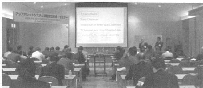
2006년 6월 일본 도쿄 APSF 창립총회