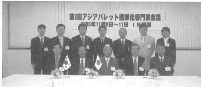
2005년 11월 일본 후쿠오카 파렛트 전문가 회의