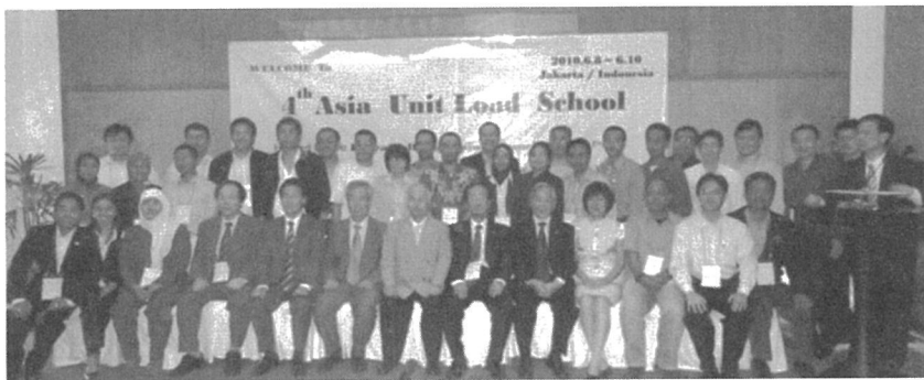
2010년 6월 인도네시아 자카르타 APSF 정기총회

- 6개국 200여명 연수 교육 실시(태국, 베트남, 필리핀, 말레이시아, 인도네시아, 인도)