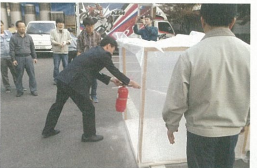
▲ 소화기 실습