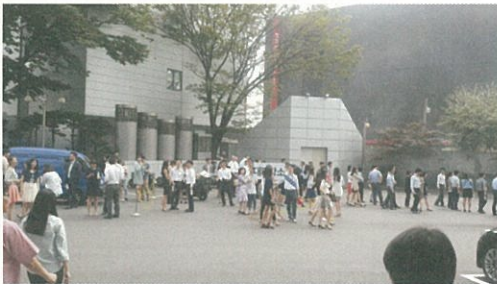
▲ 소방훈련 피난대피

지상 28층, 지하 4층, 연면적 105,407.1㎡ 규모의 LS용산타워는 리모델링 시 소방안전관리 분야에 약 70억원을 투자하여 초정밀수는 압력스위치 사용을 통한 소방펌프 동작 정밀도 향상 등 최신 소방설비로 교체하고, 각 층별 방화구획 및 특별피난계단 3개소와 비상용승강기 2대를 설치하였으며, 화재 취약지구인 지하상가에 주통로별 비상구를 8개소 확보하여 안전하고 신속한 피난이 가능하도록 하였다.