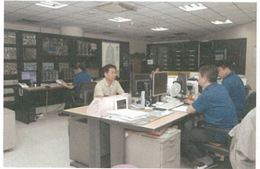
▲ 방재실 전경

소통과 책임, 열정, 창의를 핵심가치를 바탕으로 고객의 행복을 디자인하는 ‘Global Dream Company’를 꿈꾸는 LS네트웍스가 앞으로도 지속적인 성장을 이루길 바라며 탐방을 마쳤다. ☺