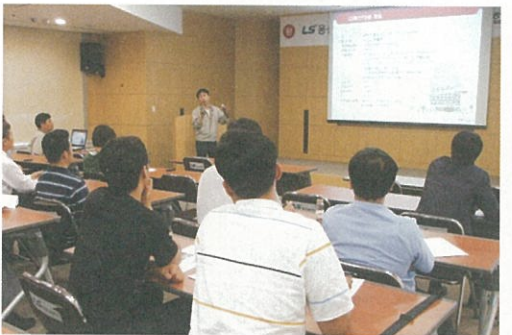
▲ 안전관리 우수사업장 견학