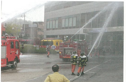
▲ 소방서 합동훈련