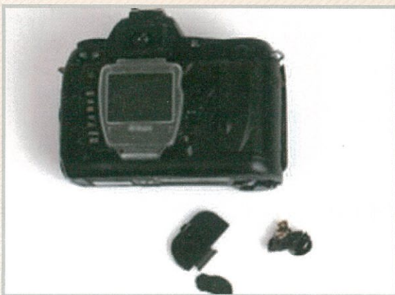
폭발사례 ('05.9월, 언론보도)