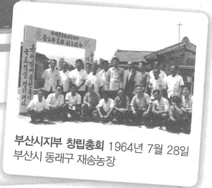
부산시지부 창립총회 1964년 7월 28일 부산시 동래구 재송농장

농민의 정신혁명, 농업의 기술혁명, 농촌의 생활혁명 실천과 자조, 자립의 정신으로 새 역사를 창조해 온 열정의 순간들