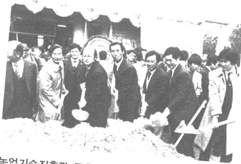
농업기술진흥관 증축 기공식 단층 건물을 3층으로 증축하기 위한 기공식 장면 1984년 11월 19일