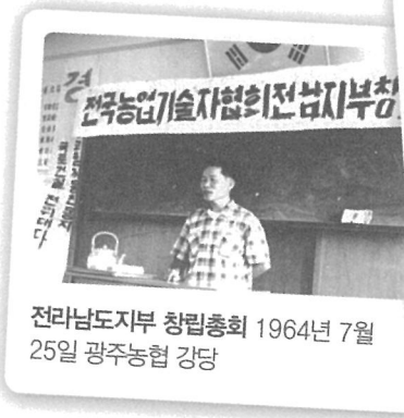
전라남도지부 창립총회 1964년 7월 25일 광주농협 강당