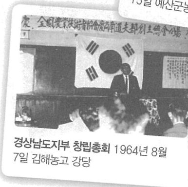
경상남도지부 창립총회 1964년 8월 7일 김해농고 강당