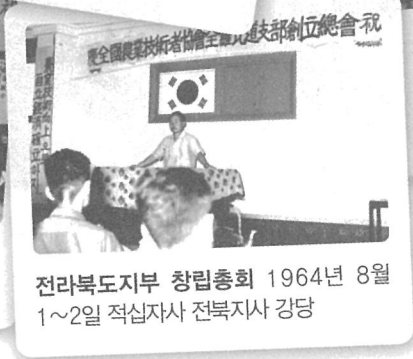
전라북도지부 창립총회 1964년 8월 1~2일 적십자사 전북지사 강당