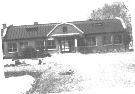
건국대 실습농장 초창기 농업기술자협회 사무실과 연수원으로 사용했던 건국대 실습농장