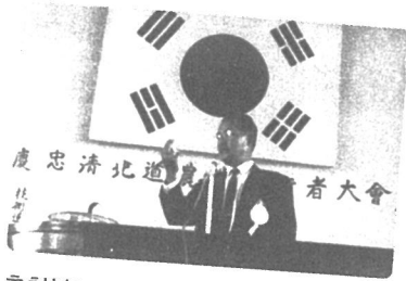
충청북도지부 창립총회 1964년 8월 16일 청주시청 회의실