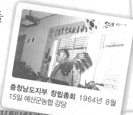
충청남도지부 창립총회 1964년 8월 15일 예산군농협 강당