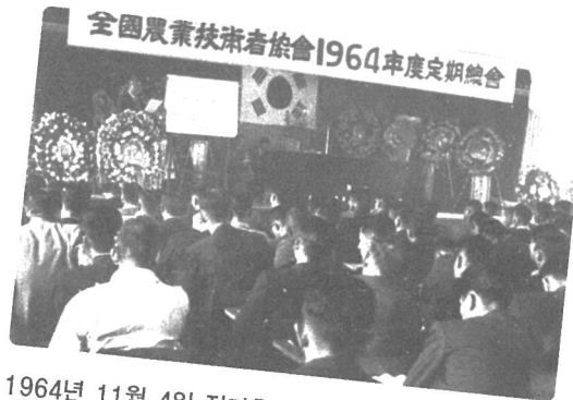
1964년 11월 4일 정기총회 창립총회 이후 처음 열린 정기총회 모습