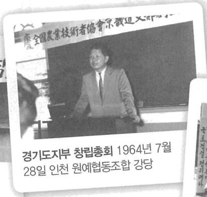
경기도지부 창립총회 1964년 7월 28일 인천 원예협동조합 강당