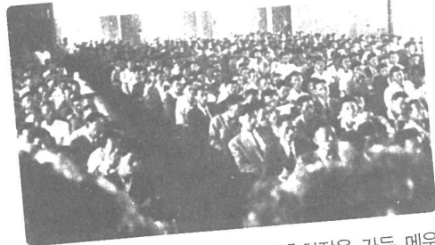
제4회 전국농업기술자대회 창립총회장을 가득 메운 제4회 전국농업기술자대회 참가자들