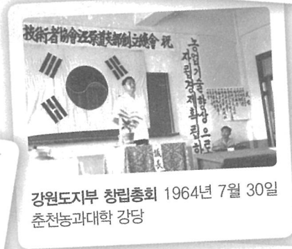
강원도지부 창립총회 1964년 7월 30일 춘천농과대학 강당

농민의 정신혁명, 농업의 기술혁명, 농촌의 생활혁명 실천과 자조, 자립의 정신으로 새 역사를 창조해 온 열정의 순간들