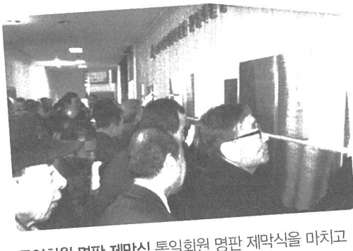
통일회원 명판 제막식 통일회원 명판 제막식을 마치고 자랑스런 16,921명의 거룩한 이름을 확인하고 있는 회원들 2012년 1월 31일