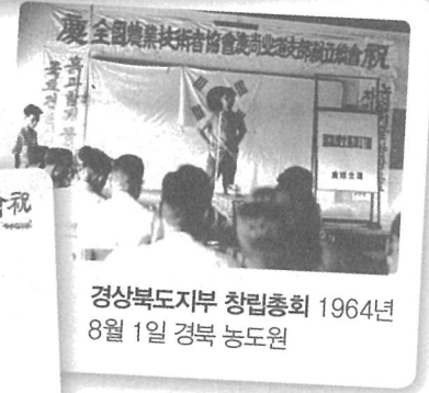
경상북도지부 창립총회 1964년 8월 1일 경북 농도원