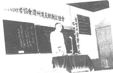
제주도지부 창립총회 1964년 8월 19일 북제주초등학교 강당