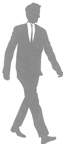
성별 10대 암 발생률

암 진단 후 5년 초과 생존한 암 환자는 41만 2,457명으로, 전체 암 경험자의 37.6%였으며 추적 관찰이 필요한 2~5년 생존 암 환자는 34만 723명으로 전체 암 경험자의 31%, 적극적인 치료가 필요한 2년 이하 생존 암 환자는 34만 4,073명으로 전체 암 경험자의 31.4%였다. ⑥