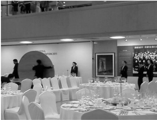
그림 4 ▶ 서울 G20국회의장회의기념 사진전과 만찬행사 준비