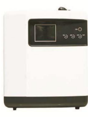
한국코스미라운드(주)의 동물의료용무균수장치 바이오사이더(동물병원 바닥 등 주변 환경 소독에 사용)