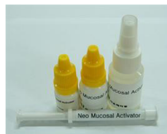
다음메디칼의 점착성투명창상피복재(개, 고양이 등 동물의 상처에 보호막을 형성하여 구강 및 외과적 상처보호에 사용)