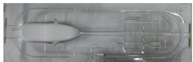
아이메디컬(주)의 경막외카테터(개, 고양이, 말 소 등의 동물의 경막외 약물을 주입하기 위한 카테터로서 1회용 제품임)