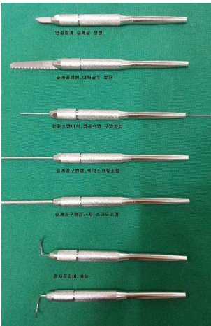
아이디어벤티메디칼의 동물외과용 핸들(개, 고양이 등 소동물의 외과, 정형수술시 피부조직절개, 분리 뼈의 분리 천공시 블레이드, 톨, 핀, 드릴 날, 니들 등의 기구를 잡아주는 데 사용)