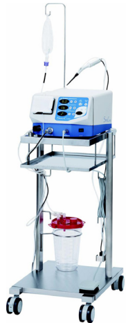
(주)유티비의 동물용초음파수술기 (초음파를 이용하여 개, 고양이, 말 등의 동물 수술에 이용하는 기구)