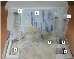
한국폴(주)의 여과방식자동혈액성분분리장치(개와 말의 혈액 내 혈소판을 분리하여 시술 부위에 투여)