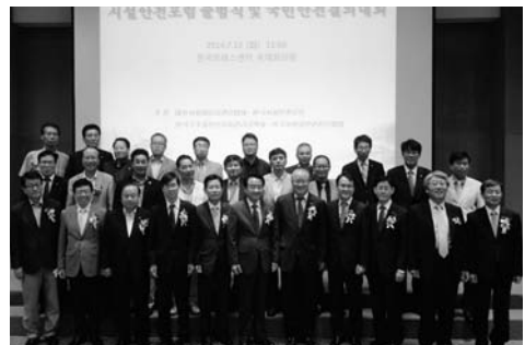
참석자 단체사진 촬영