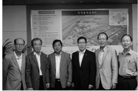
도시홍수안전포럼 회장단 간담회 기념사진