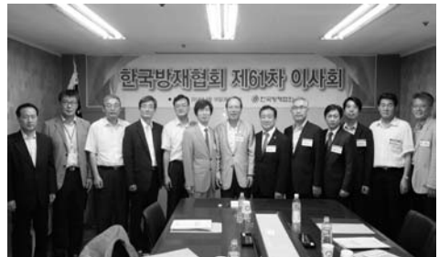
제61차 이사회 기념사진