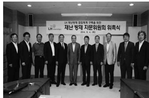
右 세 번째 한국방재협회 회장