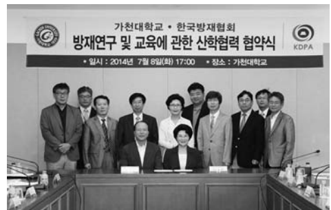
한국방재협회 · 가천대학교 업무협약식 단체사진