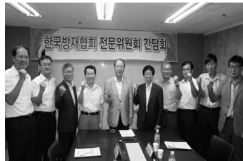
전문위원회 간담회 단체사진