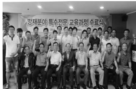
방재분야특수전문교육 60기 수료생 단체사진