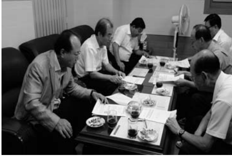
도시홍수안전포럼 회장단 간담회 회의전경