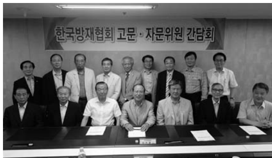
고문·자문위원 간담회 단체사진