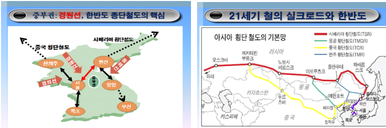
<그림 2> 경원선(중부권)의 세계의 지정학적 위상

지역을 통과하고 있다. 따라서 중부권은 DMZ공원, 남북교류 전진기지, 통일수도, 세계 정치경제의 중심지로 발전하기 위한 지정학적인 요건을 갖고 있다.