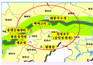
<그림 4> 중부권 접경지역 통일 유적지

이와 같이 중부권 접경지역은 삼국시대 이래로 한반도 통일의 역사적 성지로서 통일정부 수립을 위한 선조들의 피와 땀과 눈물이 서려 있는 지역이다. 이러한 역사적인 통일노력에 대한 신명적인 보은 차원에서 향후 한반도의 통일수도와 세계정부의 중심으로 발전할 수 있는 DMZ공원이 입지하게 될 것이다.