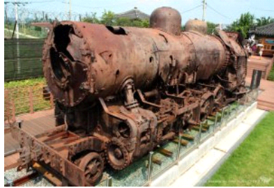
<그림 3> 철마는 달리고 싶다

현재 우리나라에서는 충청권에 세종시가 조성됨에 따라 현재 서울의 수도기능이 세종시로 이전하게 되어 향후 세종시가 수도의 역할을 수행할 것으로 기대된다. 현재 일부 행정부처와 청와대·국회가 서울에 존치함에 따라 행정기능의 이원화로 말미암아 막대한