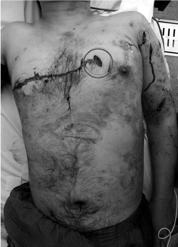
Fig. 1. Stab wound on patient's left anterior chest wall.

혈액검사에서는 백혈구 8,850/mm 3 , 혈색소 10.1 g/dL, 혈소판 362,000/mm 3 , creatine kinase (CK) 67 IU/L,