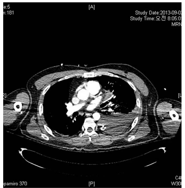
Fig. 3. Chest CT without injury to heart and great vessels.

활력징후가 계속 안정되지 않아 흉강경적 탐색술을 진행하였다. 10 mm 흉강경으로 다량의 혈종을 제거하는 중 좌심방귀에서 다량의 출혈이 있는 것이 확인되어 개흉술로 전환하였다. 심장에서 출혈되는 것을 거즈로 압박했고, 이후 심낭막 열린 곳을 통해 좌심실에서 출혈되는 부위를 확인하였다. Pledgeted suture로 출혈부위를 봉합하고 좌심방귀에서 출