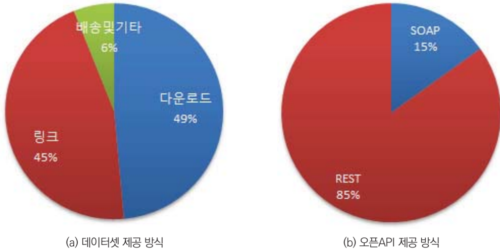
[그림 1] 데이터 제공 방식 별 서비스 방식

로 전송해 주는 방식 등이 있다. 각각의 제공 데이터들은 1개 이상의 서비스 방식으로 데이터를 제공하고 있다.