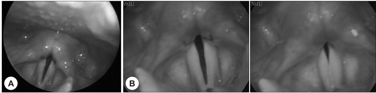
Fig. 1. Preoperative findings. A : Flexible fiberoscope finding. Bilateral vocal cord palsy is seen. B : Stroboscope findings also showed similar findings like flexible fiberoscope findings.