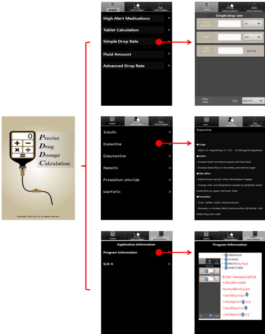
Figure 2. Example of developed smartphone-based Precise Drug Dosage Calculation Application.

상되었으나( t=1.27, p=.218 ) 통계적으로 유의한 변화는 아닌 것으로 나타났다. 그러나 두 군의 사전-사후의 점수의 변화에는 차이가 없는 것으로 나타나( t=0.97, p=.334 ) 가설 2는 기각되었다.