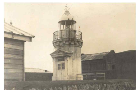
Fig. 6. Marado Lighthouse Built in 1915