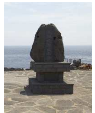
Fig. 4. Marado Monument

즉 마라도 관광객들은 마라도만이 가진 자원이나 문화를 활용한 프로그램을 더 선호하고 있어, 마라도 지역