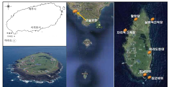
Fig. 1. Location and Shape of Marado

탐라순력도 「대정강사편」에는 마라도를 “츨녕클이 우거진 섬”으로 기록되어 있어, 마라도가 과거에는 울창한 숲이었음을 유추할 수 있다. 마라도는 ‘금섬(禁島)’으로 여겨져, 접근을 꺼려하였던 섬이었다.