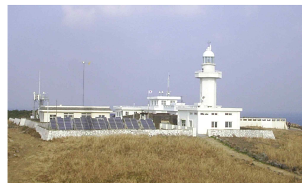
Fig. 7. Marado Lighthouse Built in 1987