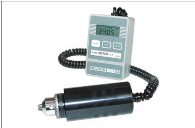
Fig. 2. Digital torque gauge (Ncm).