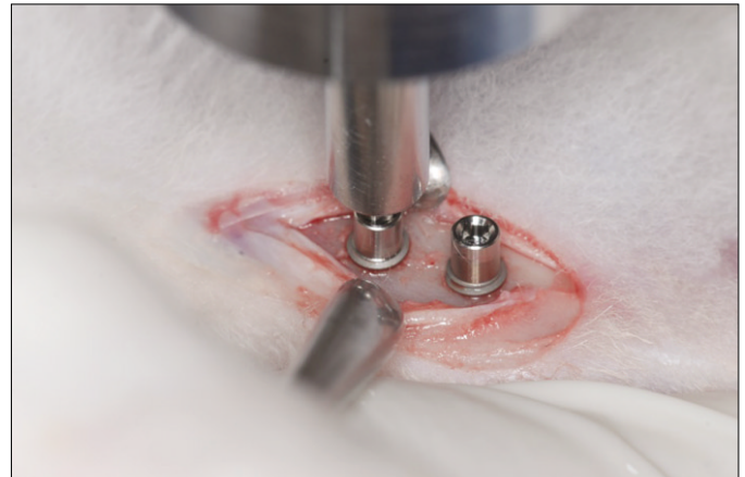
Fig. 3. A photograph of the removal torque test holding the sample. The driver is connected to the implant and the jaws of the digital torque gauge (MG12, Mark-10 Co., NY, USA).