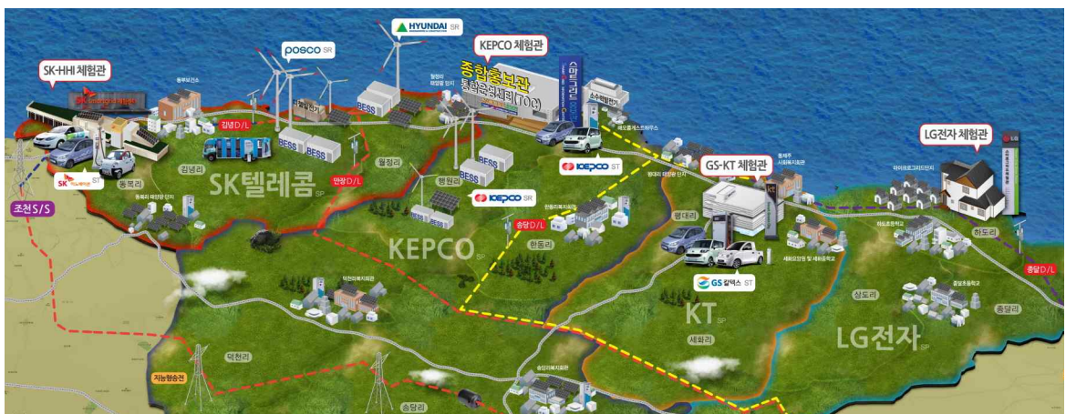
그림 7. 실증단지 조감도

전력IT 기술을 선도할 9대 핵심 기술개발 과제로는 배전지능화 시스템, 능동형 전력 텔레메트릭스 개발(화재 방지 및 재난대비 시스템), 전력선을 이용한 유비쿼터스 통신망 구현, 차세대 디지털 변전시스템 개발 등을 제시하고 전력IT 사업의 구체적인 연구개발 세부 과제에 대한 계획 수립을 위하여 국내 산·학·연 전문가 90여 명이 참여하는 전력IT기획단을 2005년 3월 발족시켰다.