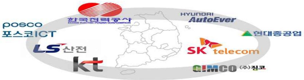
그림 10. 8개 컨소시엄 현황

총 8개 컨소시엄 1) 의 민간사업자와 전국 14개 지자체에 걸쳐 총 8,764억 원의 사업비가 소요될 예정이며, 세부적으로는 국비 3,220억, 지방비 851억, 민간 4,693억(현물 1,353억 원 포함) 원으로 구성되어 있다. 정부는 공익성이 강한 시설에 대해 설계비 및 컨소시엄별 구축비의 50% 이내에서 지원할 것을 밝힌 바 있다.