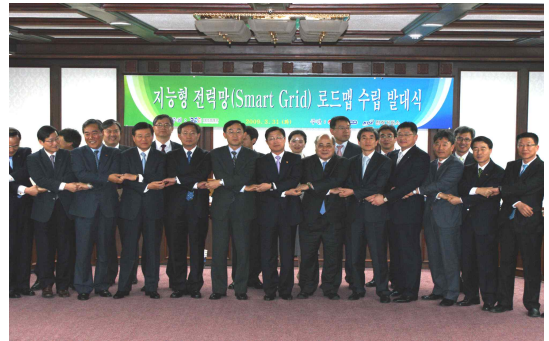
그림 8. 정부는 2009년 3월 31일 ‘지능형전력망 로드맵 수립 추진위원회’ 발대식을 열고, 세계 최초 국가 단위 스마트그리드 구축 목표를 실현할 로드맵 수립에 본격 착수하였다.

등이 참여한 가운데 ‘지능형전력망 로드맵 수립 추진 위원회’ 발대식을 개최하며 본격화하게 된다.