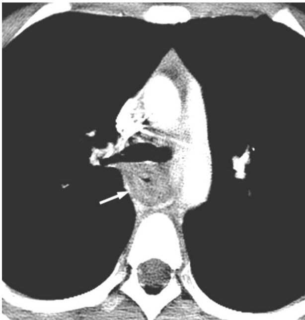
Fig. 2. Magnified view of the CT scan obtained at the level of carina shows circumferential wall thickening of the mid-esophagus (arrow).

이 재 발생하여 내원하였고, 38도 이상의 발열은 동반되지 않았으나, 미열이 있었으며, 다른 동반 증상은 없었다. 이에 시행한 식도 조영술 상 용골(carina)의 직 하부에 위치한 식도에서부터 2.5 cm 길이의 식도 분절에서 내막의 협착 소견이 발견되었다. 식도 협착이 처음 발생한 당시 환자가 항생제 치료에 불완전하게나마 증상의 호전을 보인 바 있어 항생제 치료를 먼저 시도하기로 하였고, 이전 teicoplanin을 사용하였을 시에 구역감을 보여 vancomycin (40 mg/kg/일)과 amikacin (20 mg/kg/일)을 투약하기 시작하였다. 항생제 치료에도 불구하고 증상이 지속되었고, 제 2병일부터 고열이 발생하였다. 제 4병일부터 deflazacort를 0.5 mg/kg/일 용량으로 투약 시작하였다. 제 9병일에 환자의 연하곤란과 구토 증상이 호전되었고, 식도 조영술 추적 검사 상에도 식도협착이 관찰되지 않았다. 제 12병일에 환자의 증상이 완전히 호전되어 deflazacort의 투약을 중단하였고, vancomycin과 amikacin 투약은 유지하였다. 그러나, 제 19병일에 환자는 연하곤란을 다시 호소하였다. 이에 시행한 식도 조영술 결과 상 식도 협착이 재 발생한 것이 확인 되었다. 환자의 연하곤란 증상이 이전에 비해 경한 것을 고려하여 항생제 치료를 지속하기로 하였고 metronidazole (30 mg/kg/일)을 추가하여 투약 시작하였다. Vancomycin, amikacin과 metronidazole로 1주일간 치료 후 증상은 호전되었다. 환자는 경구 항생제로 변경하여, amoxicillin and clavulanic acid (40 mg/kg/일)와 cefixime (8 mg/kg/일)을 유지하여 퇴원하였다. 이후, 환자는 9년 간 경과 관찰 중으로 폐렴 및 경부 림프절염 등의 감염으로 입원하여 감염 증상의 여부에 따라 항생제의 사용과 중단을 반복하였으나, 현재까지 식도 폐쇄 증상은 재발하지 않았다.